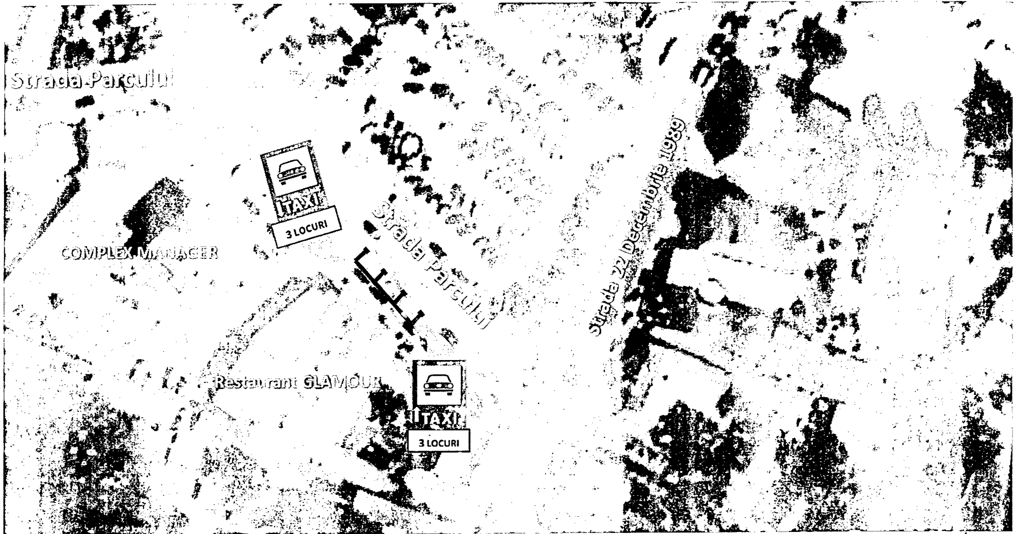
Figure 2 Plan de semnalizare pentru amenajare stație taxi - în fața la RESTAURANT GLAMOUR -