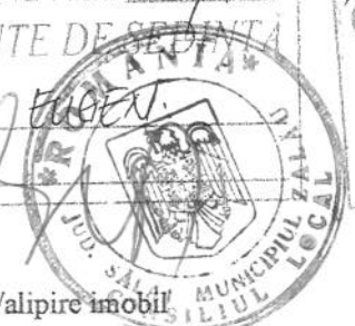
Tabel de miscare parcelara pentru dezlipire/alipire imobil